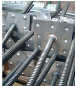
B30 met waterkering

waterkering van 200x200 millimeter. De afkort- en laswerkzaamheden hiervoor worden door Hakron zelf uitgevoerd. Zo kan Hakron niet alleen snel, maar ook tegen zeer gunstige prijzen leveren.